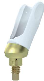
Abgewinkelte Multi-Unit Abutments werden mit einem Halter geliefert