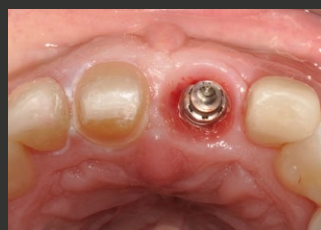
Figura 1. Tre mesi dopo il posizionamento immediato dell'impianto dell'incisivo centrale mascellare sinistro.