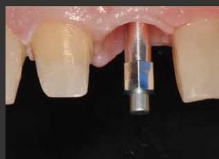
Figura 2. Lo SmartPeg NeoTell inserito per verificare la stabilità dell'impianto prima del restauro definitivo.