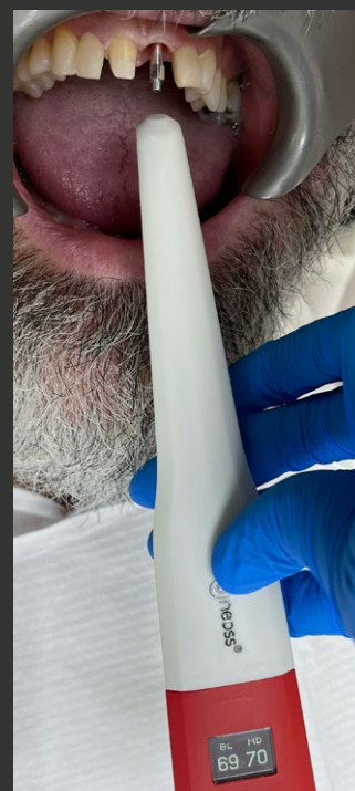
Figura 4. Valori ISQ che mostrano elevata stabilità dell'impianto e la presa dell'impronta programmata a poche settimane dopo.